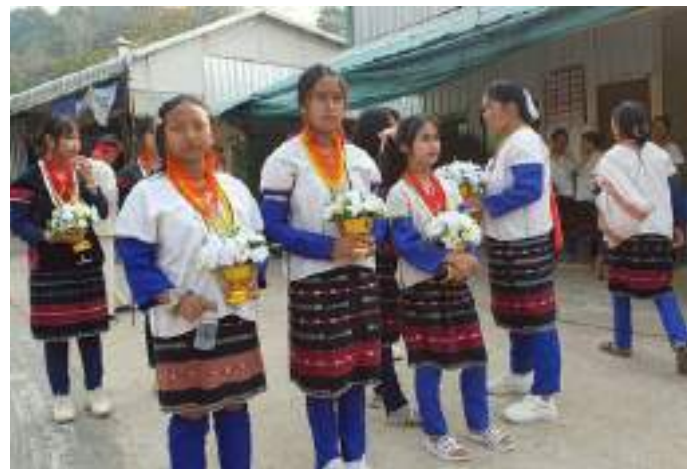
ภาพ มหกรรมสืบสานวัฒนธรรมลเวีอะ

ในปี พ.ศ. 2568 สมาคมศูนย์รวมการศึกษาและวัฒนธรรมของชาวไทยภูเขาในประเทศไทย (IMPECT) ได้ดำเนินงานสนับสนุนและขับเคลื่อนกิจกรรมร่วมกับกลุ่มชาติพันธุ์และชนเผ่าพื้นเมือง รวม 16 กลุ่ม ได้แก่ กะเหรี่ยง, กะเหรี่ยง, คะฉิ่น, ญ้อกูร, ดาราอาง, ถิ่น, ไทใหญ่, ปลัง, ปะโอ, ม้ง, ลเวีอะ, ล่าหู่, ลีซู, อ่าซ่า, อี้วเมี่ยน และจอร์กลาไว้อย โดยมีขอบเขตการปฏิบัติงานครอบคลุมพื้นที่ 8 จังหวัด 16 อำเภอ และ 22 ตำบล ในพื้นที่ภาคเหนือ ภาคกลาง ภาคตะวันออกเฉียงเหนือ และภาคใต้[1] รวมพื้นที่ปฏิบัติการทั้งสิ้น 90 แห่ง (แบ่งเป็นระดับชุมชน 63 แห่ง เครือข่าย 26 แห่ง และลักษณะกลุ่ม 1 แห่ง) ซึ่งจากการดำเนินงานดังกล่าว