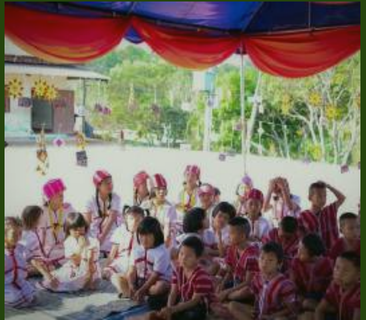
ปัจฉิมนิเทศน์นักเรียนศูนย์การเรียนรู้มอวาคี 2568