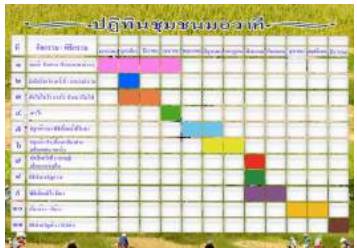
ปฏิทินชุมชนมอวาคี

นอกจากนี้ ยังมีการพัฒนาองค์ความรู้เกี่ยวกับวิถีชีวิตและวัฒนธรรมของชนเผ่าพื้นเมือง เช่น การจัดทำ ปฏิทินฤดูกาลและวัฒนธรรมของชนเผ่าพื้นเมือง จำนวน 6 ชุมชน ได้แก่ บ้านแม่ฮิแลบ บ้านอายุโก๊ะ บ้านแม่ยางมีน บ้านละออบ บ้านแม่และ และบ้านละอองเหนือ ซึ่งเป็นเครื่องมือสำคัญในการถ่ายทอดองค์ความรู้และวิถีชีวิตของชุมชน