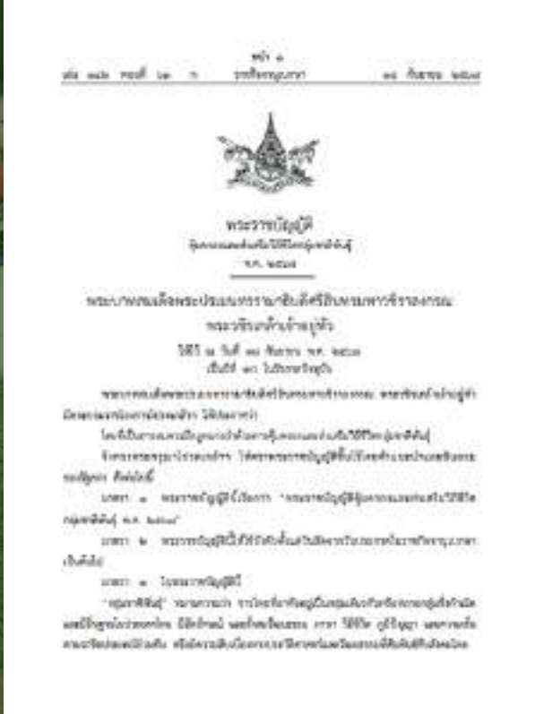
พระราชบัญญัติคุ้มครองและส่งเสริมวิถีชีวิตกลุ่มชาติพันธุ์ พ.ศ. 2568

กระบวนการติดตามนโยบายดังกล่าว รวมถึงการมีส่วนร่วมในกระบวนการติดตามอนุสัญญาาระหว่างประเทศด้านสิทธิมนุษยชน เป็นโอกาสสำคัญในการเสริมสร้างศักยภาพของคนรุ่นใหม่ชนเผ่าพื้นเมือง ให้สามารถมีบทบาทในการขับเคลื่อนและปกป้องสิทธิของชนเผ่าพื้นเมืองในอนาคต